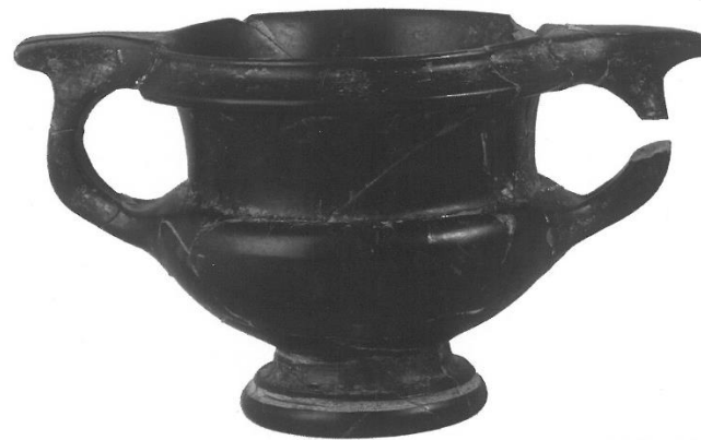
Kantharos ático de barniz negro. F40EIL./Cuadrado-F3521M